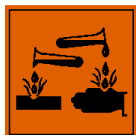
C - Bijtend

Gevaarlijke bestanddelen : Isophorondiamine, Benzylalcohol R-zinnen : R20/22 - Schadelijk bij inademing en opname door de mond R34 - Veroorzaakt brandwonden R40 - Carcinogene effecten zijn niet uitgesloten R43 - Kan overgevoeligheid veroorzaken bij contact met de huid S-zinnen : S23 - Damp/spuitnevel niet inademen (toepasselijke term(en) aan te geven door de fabrikant) S26 - Bij aanraking met de ogen onmiddellijk met overvloedig water afspoelen en deskundig medisch advies inwinnen S36/37/39 - Draag geschikte beschermende kleding, handschoenen en een beschermingsmiddel voor de ogen/het gezicht S45 - Bij een ongeval of indien men zich onwel voelt, onmiddellijk een arts raadplegen (indien mogelijk hem dit etiket tonen) S53 - Blootstelling vermijden - vóór gebruik speciale aanwijzingen raadplegen S28 - Na aanraking met de huid onmiddellijk wassen met veel ... (aan te geven door de fabrikant)